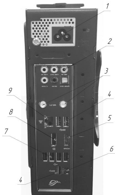
Рисунок 1 – Подключение контроллера видеостены